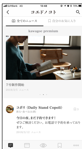
アプリメイン画面